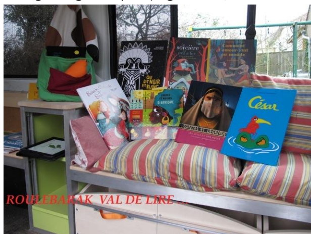
Roulebarak Vue Intérieure

Tous les travaux qui relèvent d'un cadre réglementaire sont ou ont été réalisé par un professionnel, le reste par un bénévole de l'association.